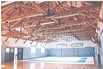
● 国の登録有形文化財「生徒館」の内部