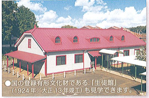
●国の登録有形文化財である「生徒館」(1924年/大正13年竣工)も見学できます。